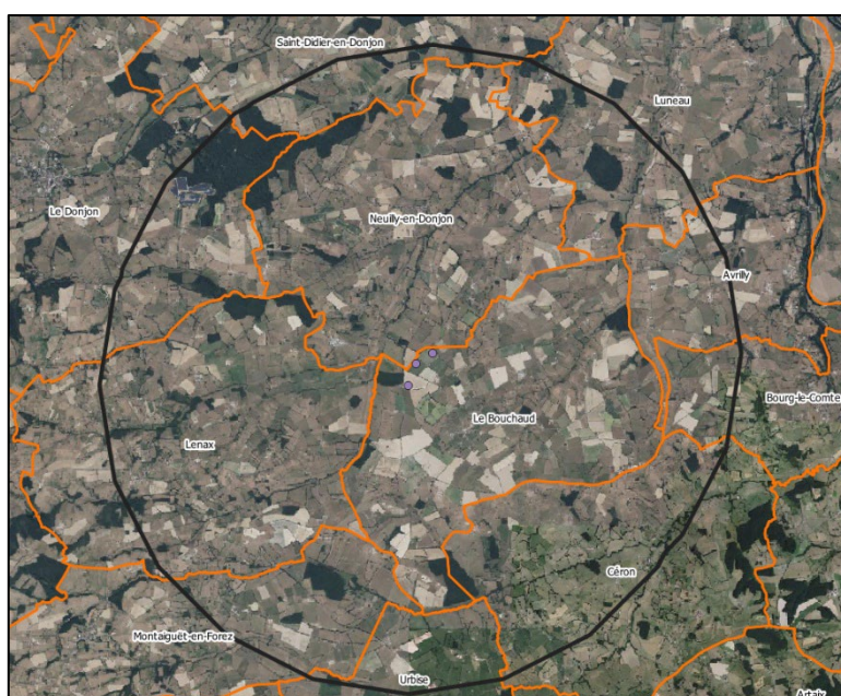
Périmètre de l'enquête publique